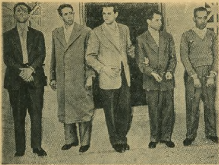
Французские власти в Алжире арестовали руководителей деятелей алжирского национально-освободительного движения. Они вылетели на Марокко в Тунис на самолете, предоставленном марокканскими властями.

По указанию французских властей самолет был посажен на военный аэродром в Алжире.